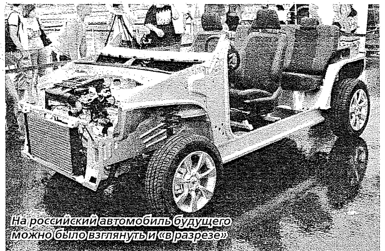
На российский автомобиль будущего можно было взглянуть и «в разрезе»