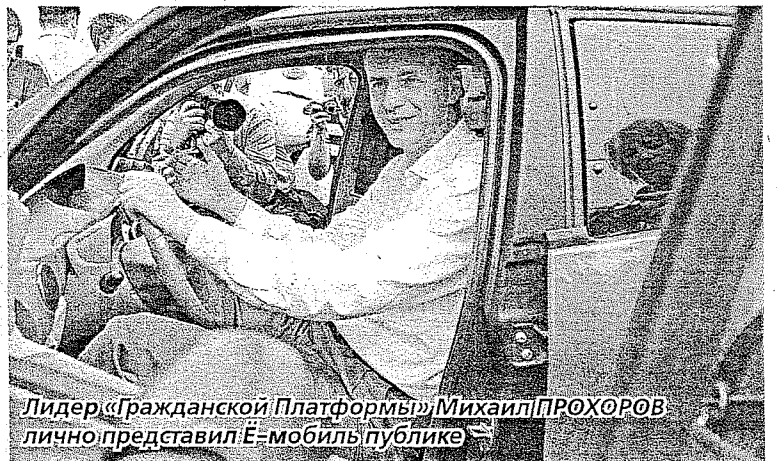
Лидер «Гражданской Платформы» Михаил ПРОХОРОВ лично представил Э-мобиль публике