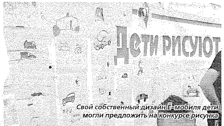
Свой собственный дизайн Э-мобиля дети могли предложить на конкурсе рисунка