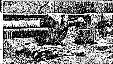
Тепловые сети во Вла-

ВВЕСТИ ДОПОЛНИТЕЛЬНЫЕ ТАРИФЫ НА РАЗВИТИЕ КОММУНАЛЬНЫХ СЕТЕЙ